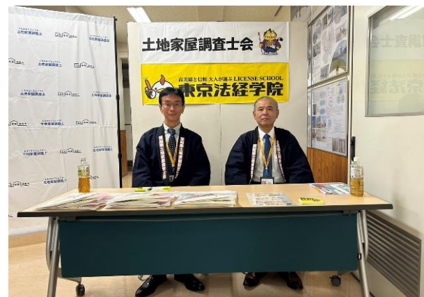
岡地広報部委員と大岩副会長