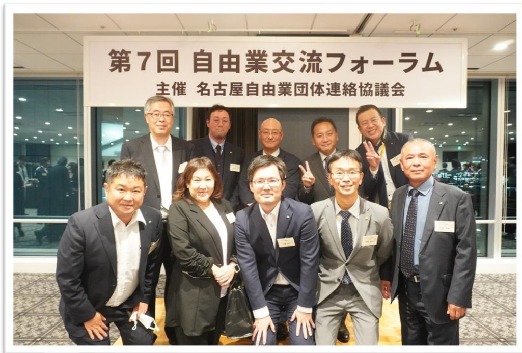
調査士会参加者のみなさんと広報部役員