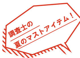
空調服と蚊取り線香